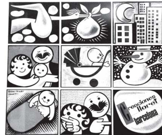
Fotografia Salvador Lladó

A partir de 1951 comença a tenir encàrrecs de diferents editorials per fer il·lustracions de llibres, i a partir de llavors entra a treballar a Publicitat Zen. El 1954, juntament amb Alcoy, Hernández Pijoan, Planell i Terri, formen el grup Sílex.