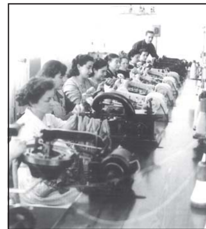
En primer terme, operària amb la remalloso que tancava la puntera de les mitges, i al costat la grega, que feia les costures.