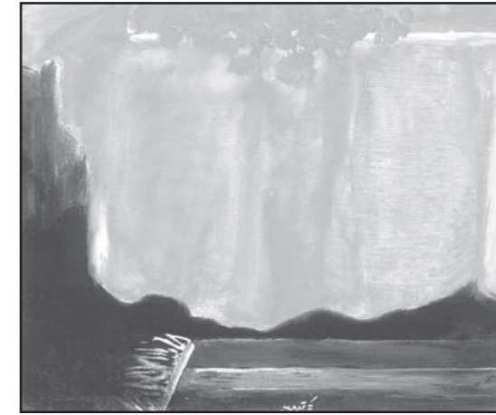
Fotografia de l'autor