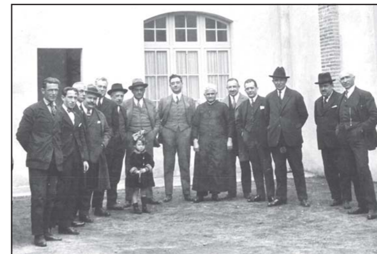
Fotografia Família Guañabens.