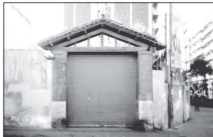
Porta d'entrada (any 2005).