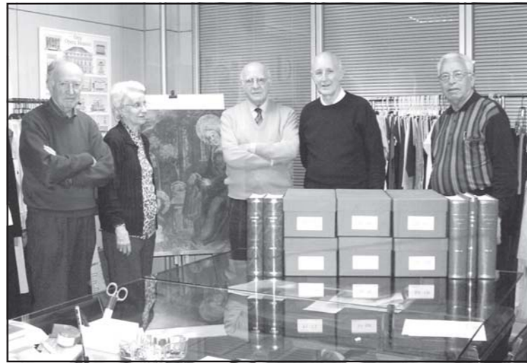
Lliurament de la col·lecció.