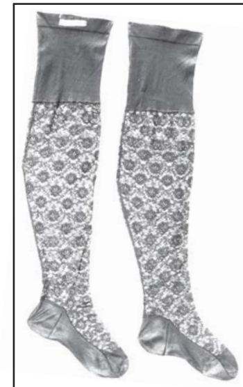
Mitges de l'època de la marquesa de Pompadour (1721-1764).

En aquests quaranta-quatre anys la col·lecció de mitges, formada per cent quaranta-cinc parells, només ha vist la llum en tres ocasions; una part, durant els anys seixanta, en un important centre comercial de Madrid; la col·lecció sencera, l'any 1982, a Terrassa, amb motiu de la XXXI Festa