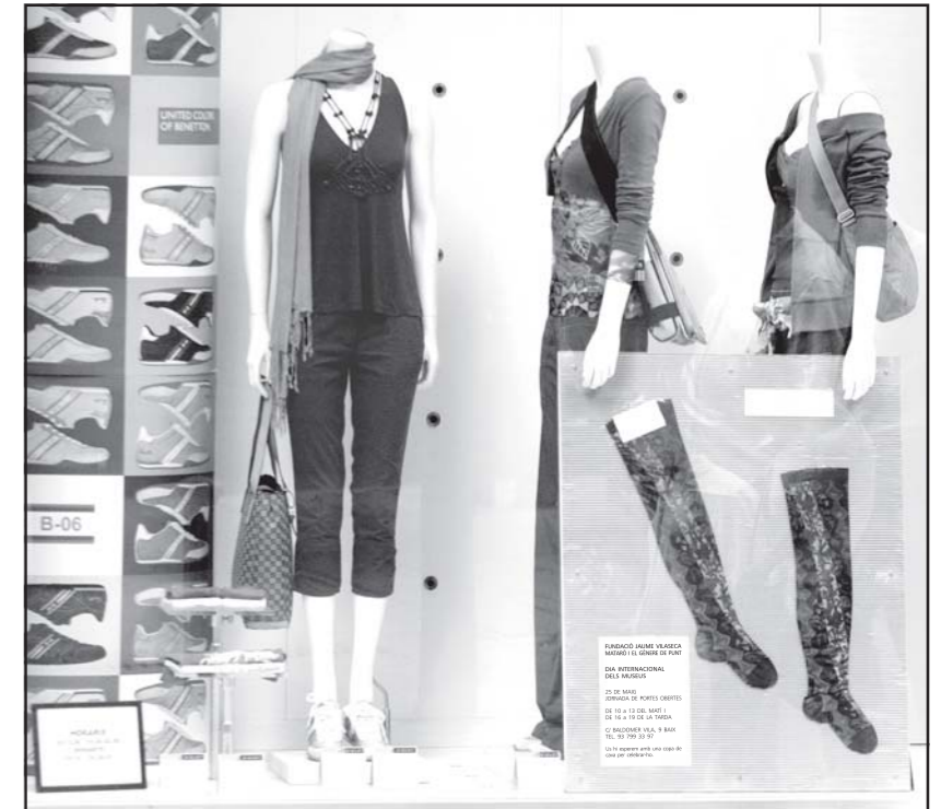
Aparador de Benetton a la Riera, amb publicitat del Museu.

Certament que la nostra col·lecció és digna, molt digna, n'estem satisfets i orgullosos... Però no defallirem ni claudicarem fins a veure-la al lloc que es mereix, que la ciutat es mereix.