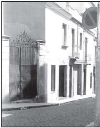
Primer taller, a la baixada Feliu.