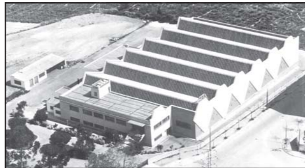
Emplaçament definitiu, a la plaça Pintor Cusachs.