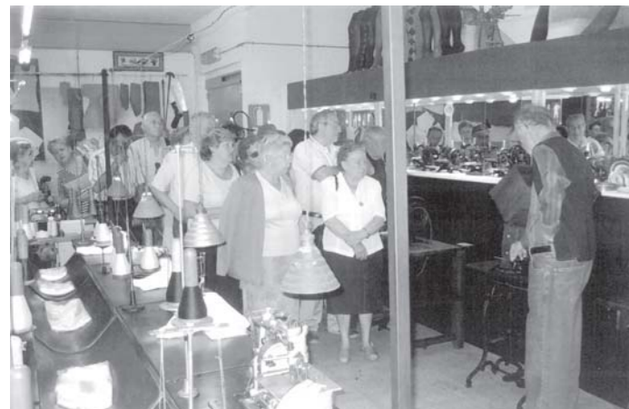
Nombrós grup de visitants.

El passat dia 20 d'octubre van visitar les nostres instal·lacions quinze persones que formaven part del Pla de Dinamització del Turisme Industrial de Catalunya, promogut per la Diputació de Barcelona.