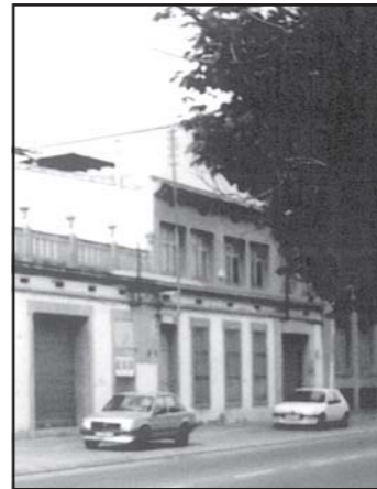
Taller del Camí Ral.

L'activitat de l'empresa es va mantenir fins a l'any 1969 en què es va produir el tancament, motivat, com en tantes altres empreses, per les dificultats del moment, la crisi econòmica, etc. El personal, uns trenta treballadors, se'ls va indemnitzar en efectiu.