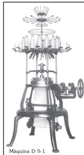
Màquina D S-1