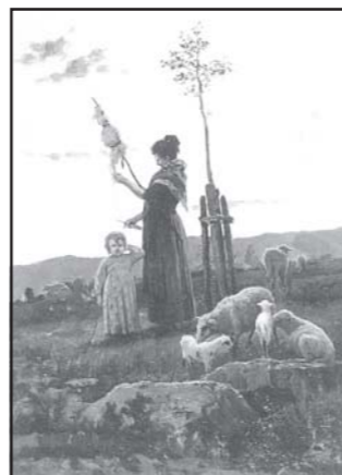
Pintura de Joaquim Vayreda i Vila

Del poema de Mn. Cinto Verdagué, Canigó Títol «Nuviatge/cant VI»