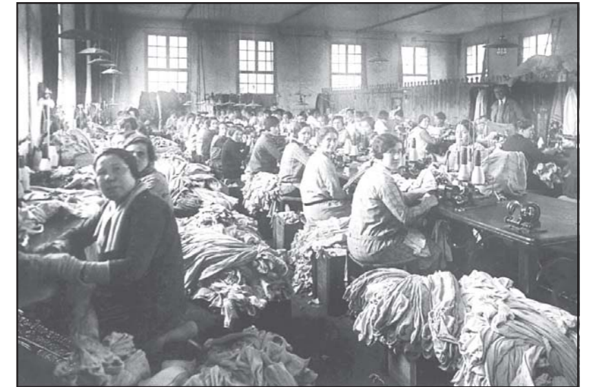
Interior de la fàbrica de gènere de punt Can Minguell.

També la segona meitat del segle XX foren anys d'eufòria econòmica, les fàbriques de gènere de punt aconseguiren noves parcel·les de mercat i es va crear la necessitat de nova mà d'obra, moment d'atracció per a