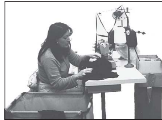
Repuntadora de «Goher Textil Calella».

En varen construir les firmes «Ray, S.A.» i «Llambresca» de Mataró, i «Gubtor» d'Arenys de Munt.