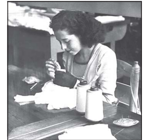
Resseguidora de Mfras. Antonio Gassol, S.A.

La màquina de repuntar, també anomenada «plana», fa el cosit amb càpsula i bobina i generalment és d'una agulla. Per tant, el sistema és igual que la domèstica, amb la particularitat de ser mecànicament més consistent i treballar a alta velocitat (3.000 rpm aproximadament, quan la domèstica acostumava a anar amb pedal). A Catalunya s'havien construït màquines d'aquest tipus però domèstiques, no industrials, o almenys no en tenim referència; en canvi, avui dia encara hi ha la «Refrey» a Vigo i l'«Alfa» a Eibar.