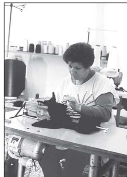
Overlockista de «Goher Textil Calella».

En construïen «Nogma», «Tejidos de Punto-Ray, S.A.» i «Supercús» a Mataró, i «Niel» a Arenys de Mar.