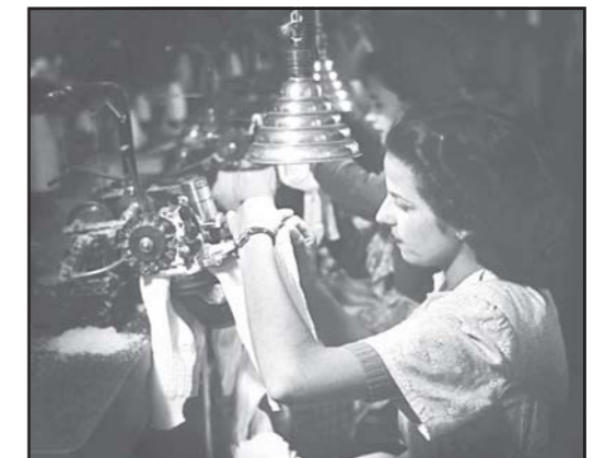
Treballadora de «Hijos de Jaime Torrellas, S.A.».

És una feina que moltes dones fan a casa, ja que es tracta d'una màquina petita, primer manual i després ja amb motor. La màquina porta uns ganivets que tallen el gènere sobrant i uns raspalls que netegen el borrisol. A Mataró, n'havien construït els tallers de Torrent, Pruna, Merino i Burniol.