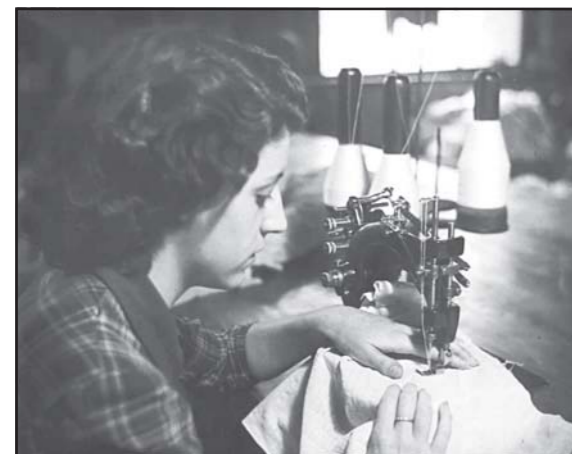
Cosidora a «Tejidos de Punto, S.A.»